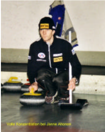
Vale Konsultation bei Janne Ahonen

Auch hier das gleiche wieder wie bei den Norwegern: ein ausgezeichnetes Gefühl für das Sliden bei allen Akteuren und auch sehr schnell kam es zu einem internen Mannschaftsturnier. Zaungäste fanden sich dann auch sehr schnell ein. Bei den anwesenden Kurgästen im Eisstadion sprach es sich offensichtlich schnell herum, dass die Norweger um Roar Ljoekelsoey, Sigurd Pettersen und die Finnen um die Stars Janne Ahonen ( der zum Zeitpunkt im Weltcup Führende) und Risto Jussilainen sich aufs glatte Eis begeben haben um Curling zu spielen.