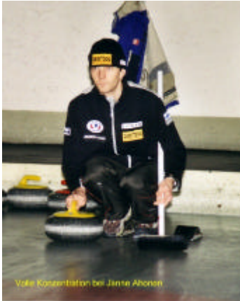
Viele Konzentration bei Janne Ahonen